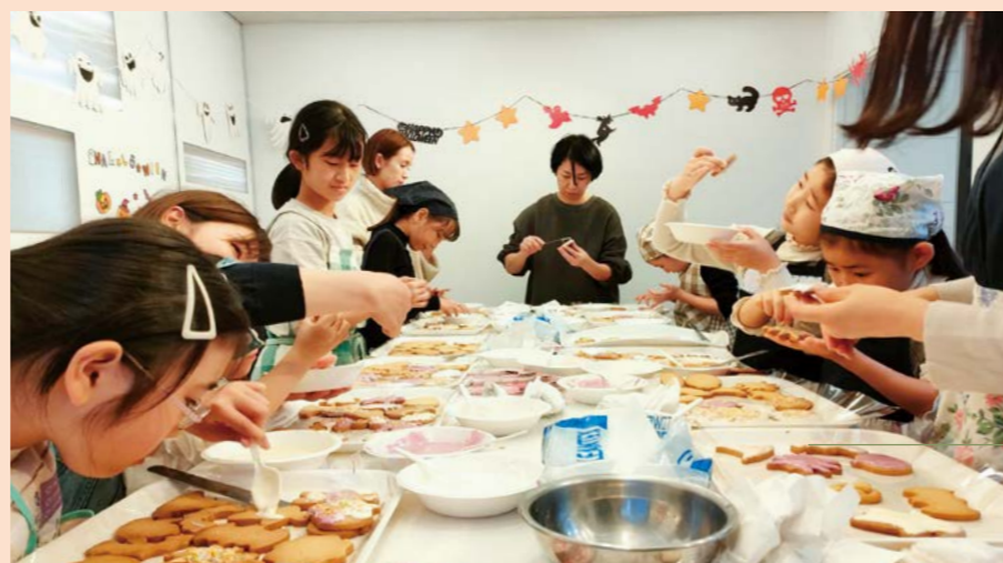
ご好評いただいた親子パン教室