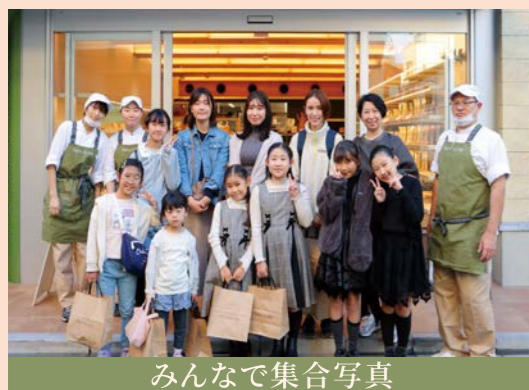
みんなで集合写真

Farm to Me サークルは、来店たびにポイントが貯まる仕組みです。ベーカリーでもレストランでも、500円のご利用ごとに1ポイントが加算されます。LINEよりご参加いただけます。ポイントが積み重なるほどに、Farm to Meとの関わりが少しずつ広がっていきます。ランクが上がれば、より充実したクーポンや特典もご案内できるようになります。でも私たちがお届けしたいのは、割引以上の何か。「この場所でしか体験できないこと」が増えていく、そんな関係です。