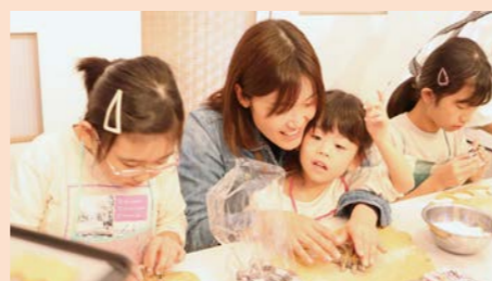
体験したお客さまの様子