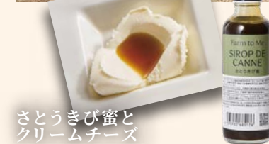
さとうきび蜜と クリームチーズ