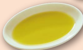
シチリア産 有機オリーブオイル