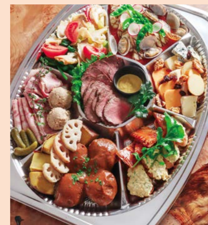
Farm to Me オードブルセット